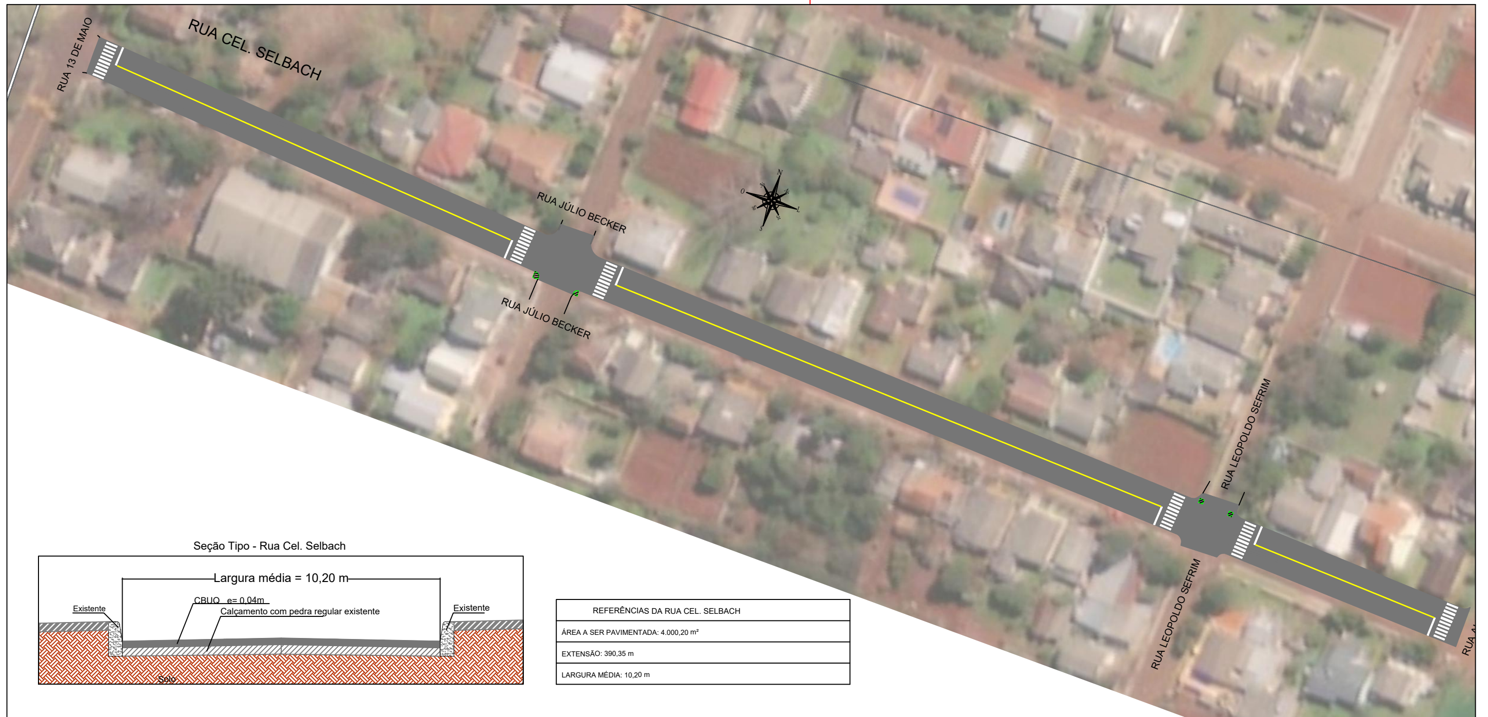
Seção Tipo - Rua Cel. Selbach